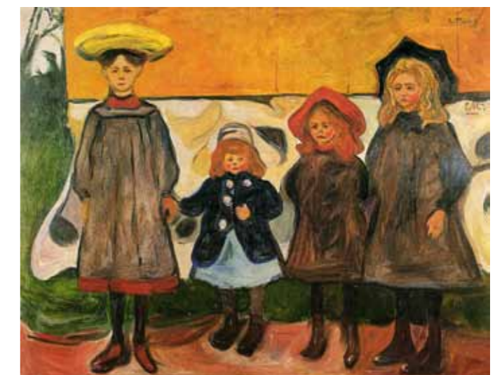
Four Girls in Arsgardstrand von Edvard Munch