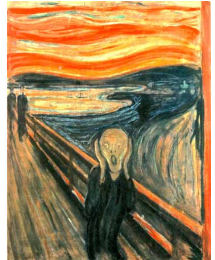
„Der Schrei“ - Berühmtestes Werk von Edvard Munch